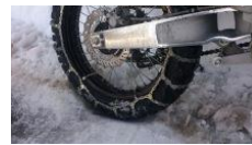
AJPIにチェーン巻きました