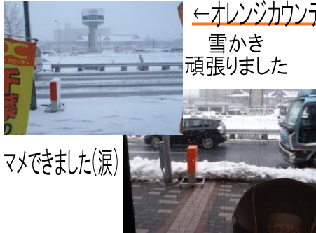
←オレンジカウンティ前 雪かき 頑張りました

東京モーターサイクルショー 前売り券発売中!! 2014 3/28(金)・29(土)・30(日)